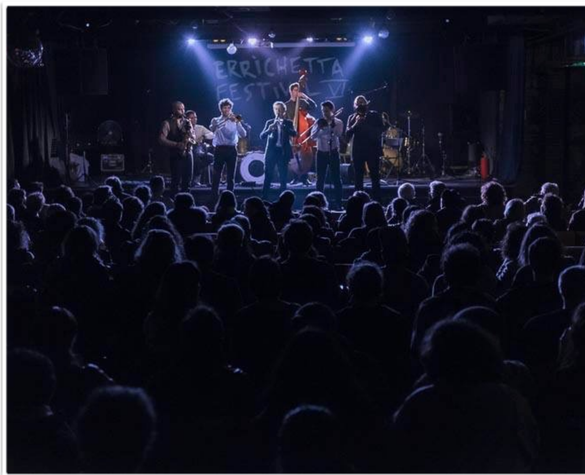
Kosmopolitevitch en live au festival « Errichetta », à Rome, janvier 2016

Ensemble de musique traditionnelle des Balkans